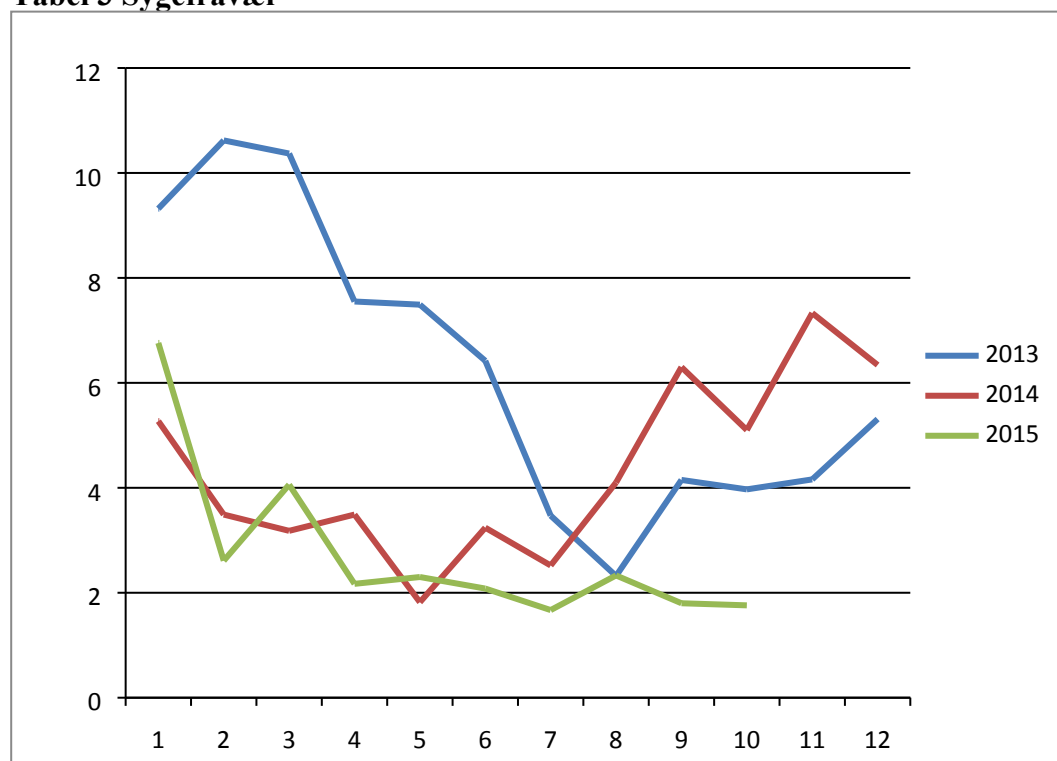
Table 3 Sygefravær